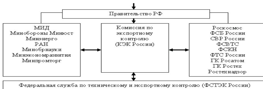
Система российских государственных структур, вовлеченных в осуществление функций экспортного контроля

Комиссия по экспортному контролю (КЭК России) – обеспечивает проведение единой государственной политики, осуществляет организационно-методическое руководство и координацию деятельности федеральных органов исполнительной власти, участвующих в работах по экспортному контролю.