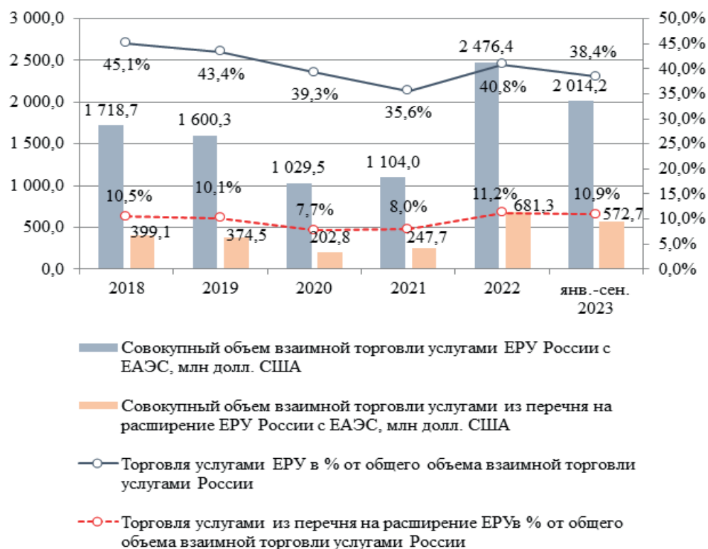
Рис. 6 – Динамика взаимной торговли услугами ЕРУ и услугами из перечня на расширение ЕРУ России с ЕАЭС в 2018-2023 гг.

Fig 6 – Dynamics of mutual trade in ERU services and services from the list of ERU expansion in Russia with the EAEU in 2018-2023