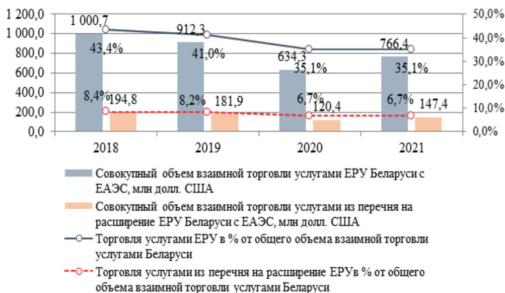
Рис. 3 – Динамика взаимной торговли услугами ЕРУ и услугами из перечня на расширение ЕРУ Беларуси с ЕАЭС в 2018-2021 гг.

Республика Беларусь. Объем взаимной торговли услугами ЕРУ Беларуси с ЕАЭС также сократился в 2018-2021 гг.: с 1001 до 766 млн долл. США, а услугами из перечня на расширение ЕРУ – со 195 до 147 млн долл. США. Доля первой группы услуг в общем объеме взаимной торговли услугами Беларуси за период изменилась с 43,4% до 35,1%, второй – с 8,4% до 6,7% (см. рисунок 3).