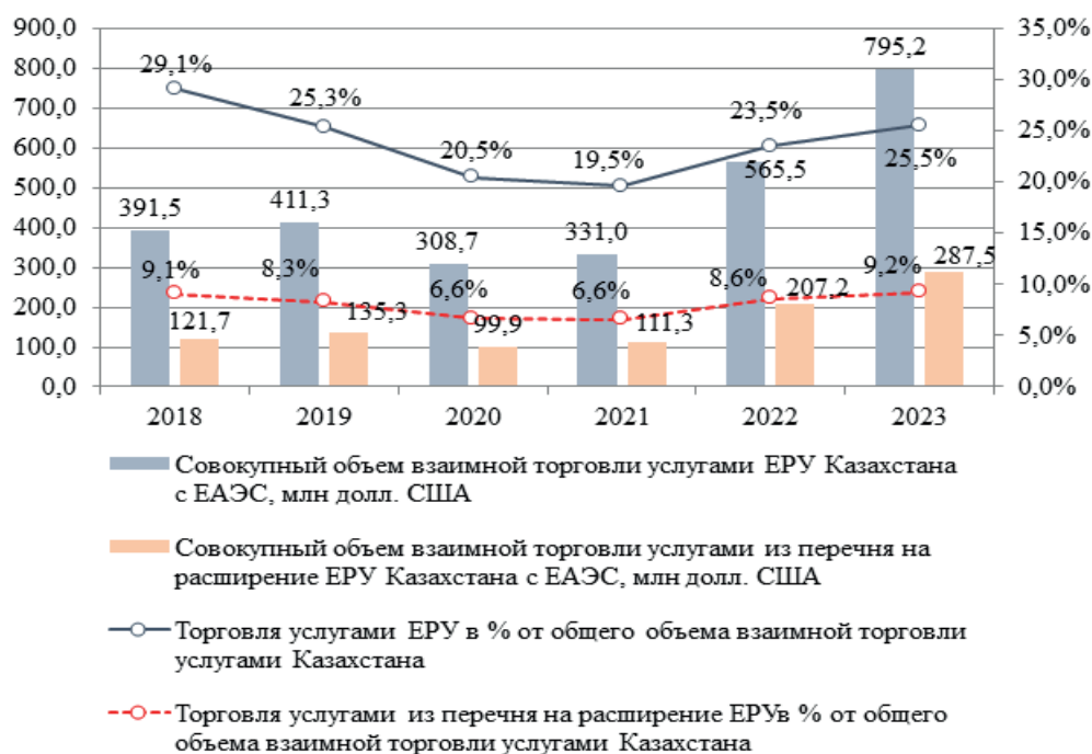
Рис. 4 – Динамика взаимной торговли услугами ЕРУ и услугами из перечня на расширение ЕРУ Казахстана с ЕАЭС в 2018-2023 гг.

Fig. 4 – Dynamics of mutual trade in ERU services and services from the list of ERU expansion in Kazakhstan with the EAEU in 2018-2023