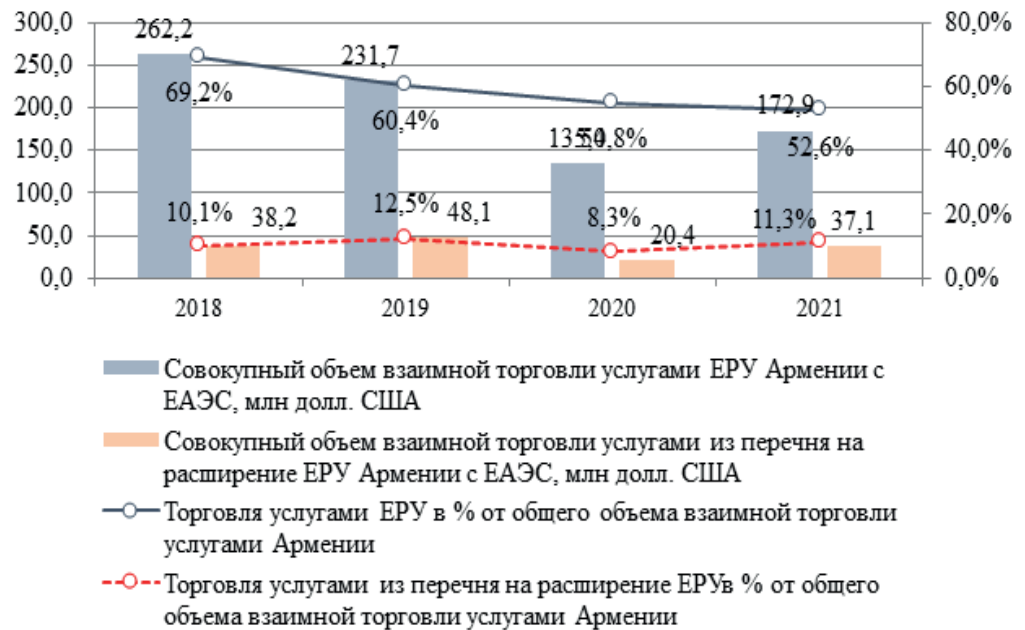
Рис. 2 – Динамика взаимной торговли услугами ЕРУ и услугами из перечня на расширение ЕРУ Армении с ЕАЭС в 2018-2021 гг.