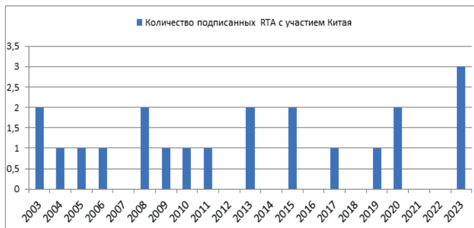
Рис. 1. Количество подписанных Китаем региональных торговых соглашений (RTA) по годам, единиц. 12

По состоянию на 2025 год Китай является участником 21-го регионального торгового соглашения с 29 странами (см. рисунок 1), на которые в совокупности приходится 65% китайского экспорта товаров. 11