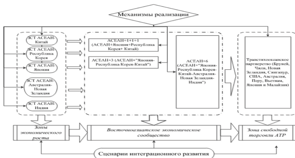
Форматы интеграционного сотрудничества стран ЮВА в АТР