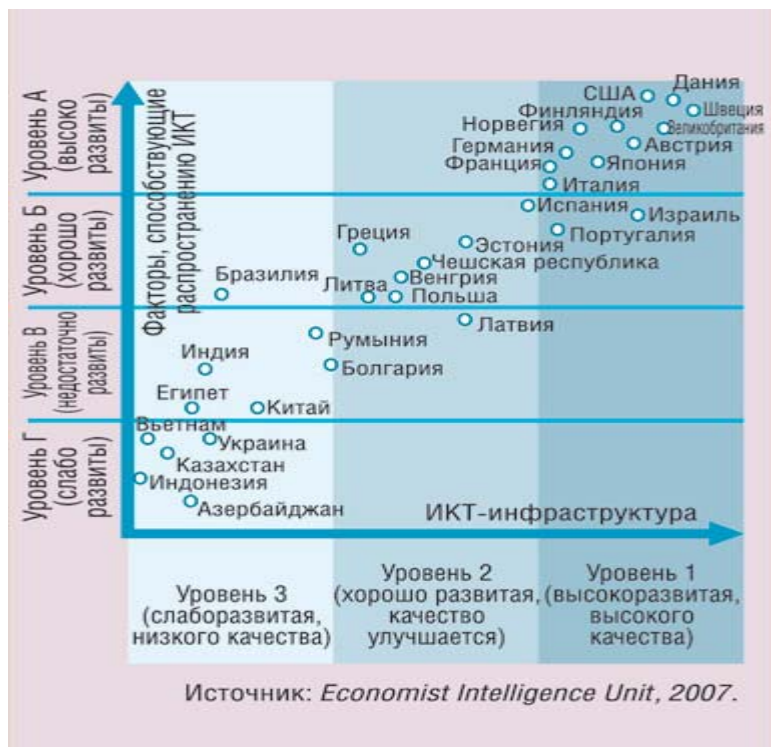
Диаграмма развития ИКТ в разных странах мира

Режимы интеллектуальной собственности на многих новых рынках становятся более эффективными, однако необходимо дальнейшее развитие. Защита интеллектуальной собственности остается важным фактором обеспечения конкурентоспособности информационных технологий. Создание правовой среды, защищающей права на интеллектуальную собственность и позволяющую решать проблемы киберпреступности на международном уровне, является важной задачей для любого правительства. 24