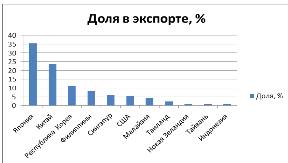
Поставки нефти ВСТО по странам в первом полугодии 2013 года